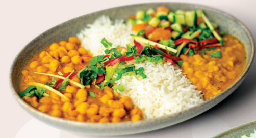
PUNJABI STYLE BOWL VG