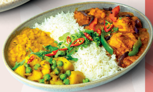
CHICKEN TIKKA MASALA BOWL